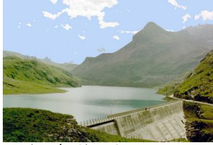
Randonnée Glace & Eau